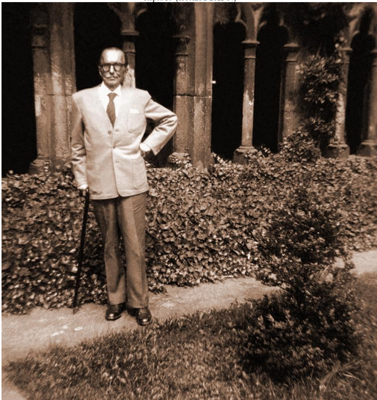
Цюрих 1955 г.